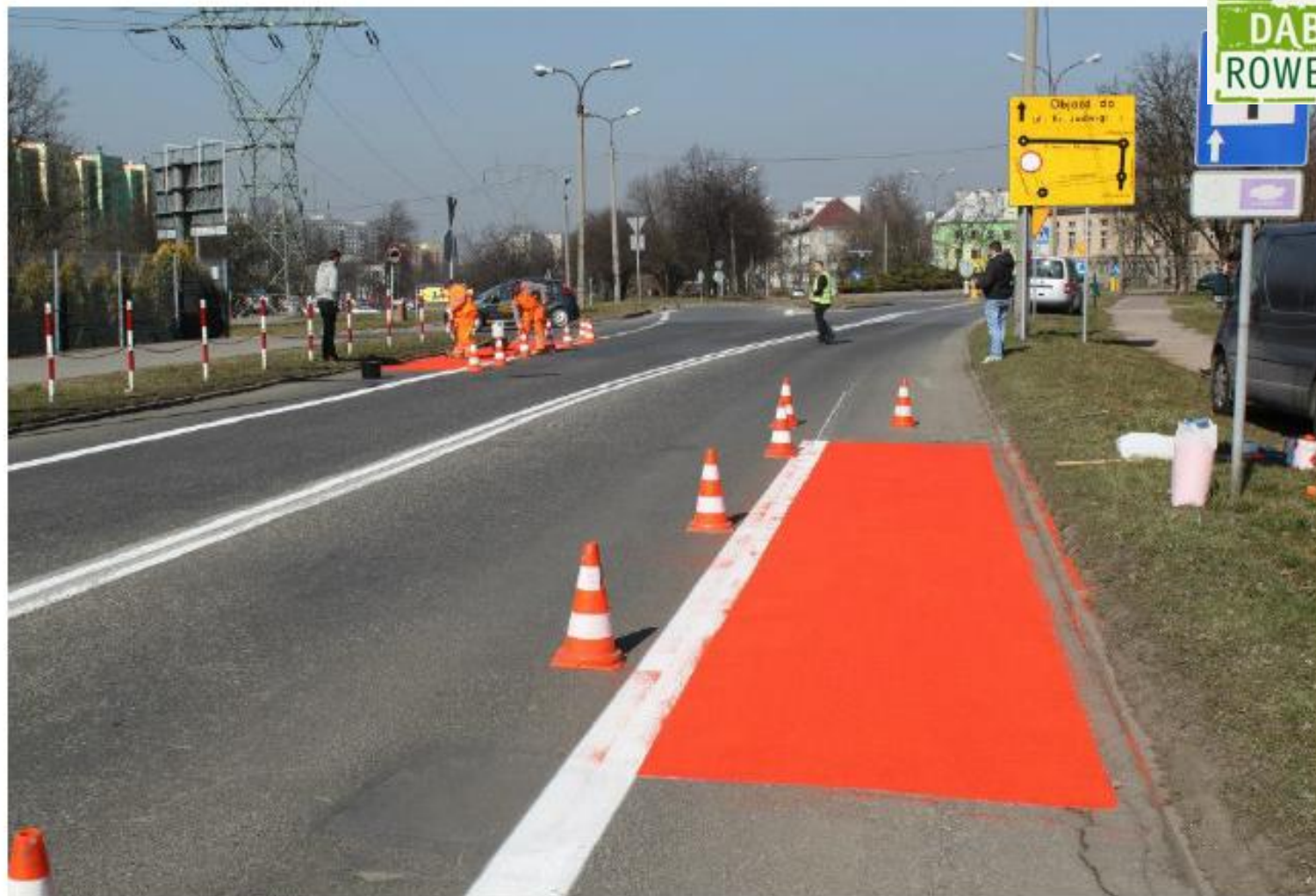
Zakończenie pasa ruchu dla rowerów przed małym rondem