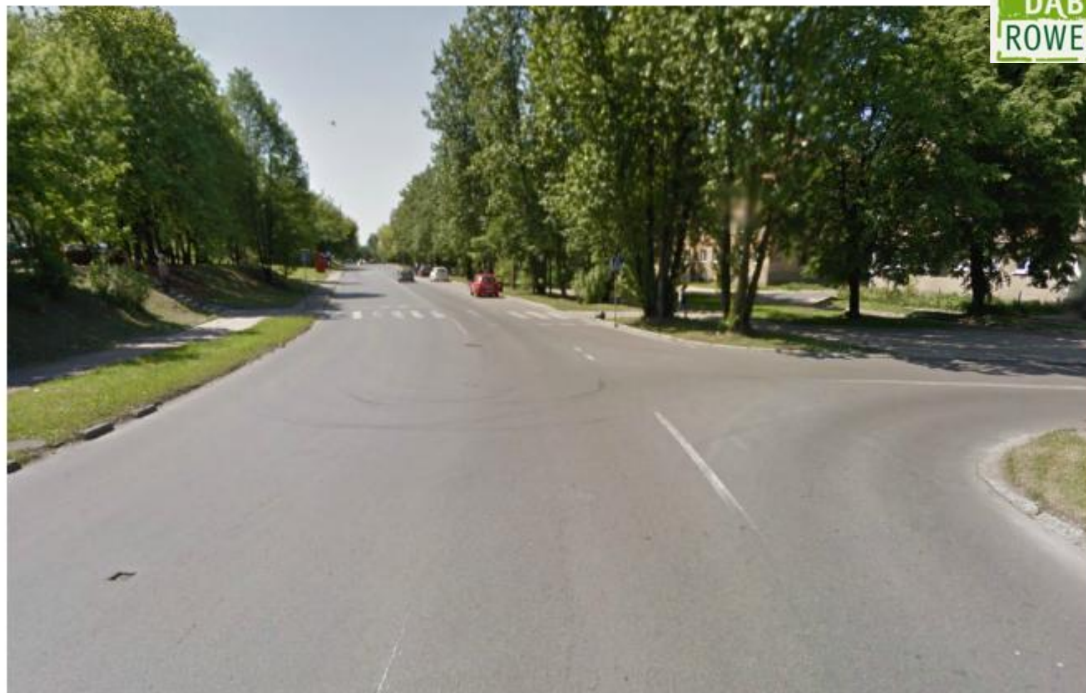
Pasy ruchu dla rowerów (Przed)