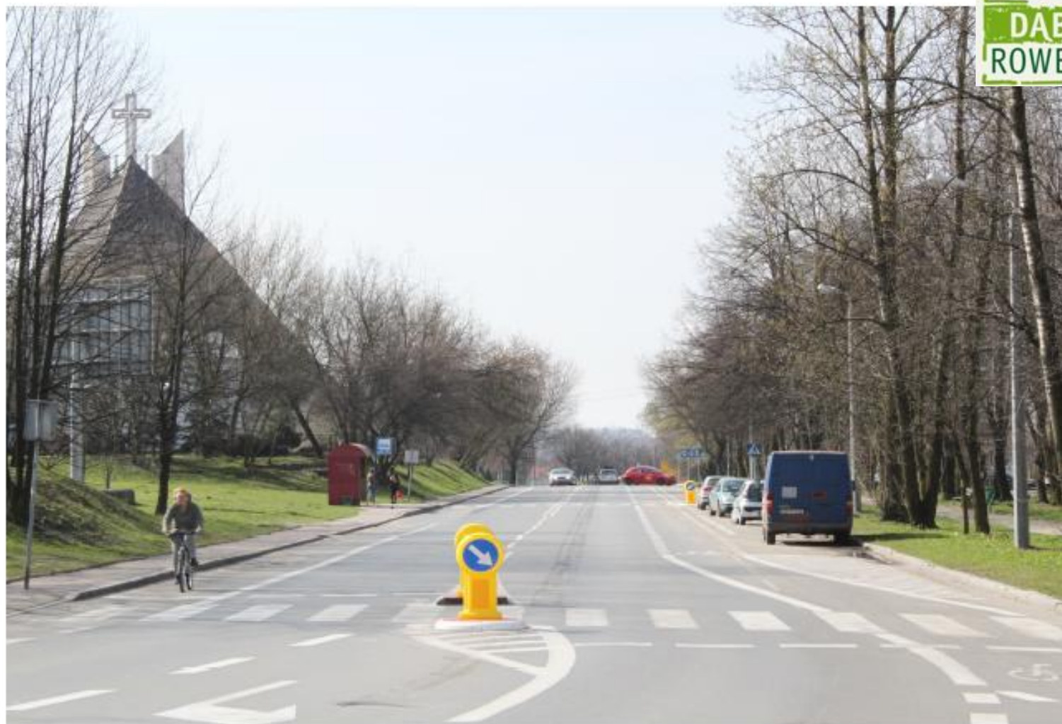
Pasy ruchu dla rowerów (Po)